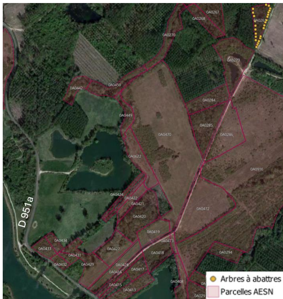
Travaux sylvicoles sur les parcelles de l'agence de l'eau sur le territoire de la Bassée, vallée de la Seine entre Nogent-sur-Seine et Montereau-Fault-Yonne